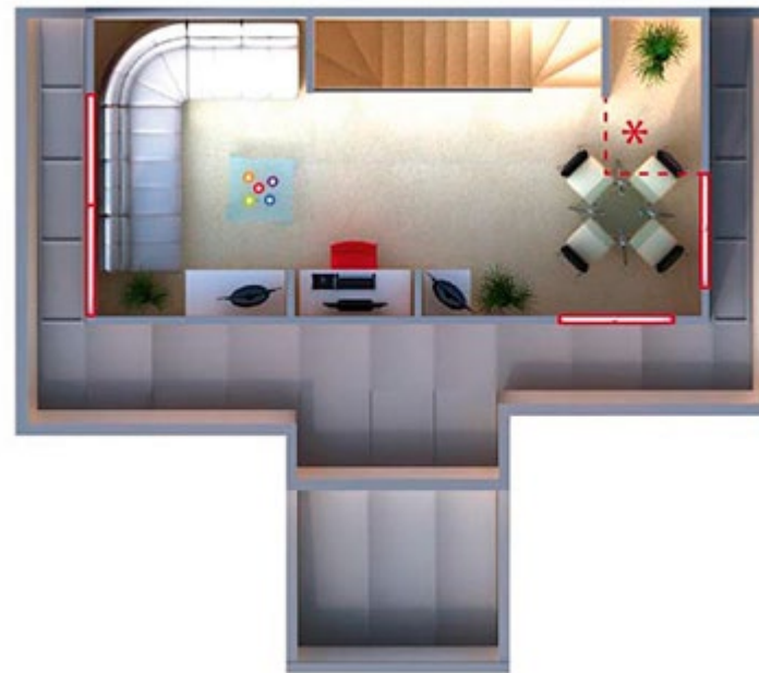
Tercer piso * Baño opcional — Posición ventanas según casa